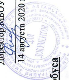
График движения школьного автобуса